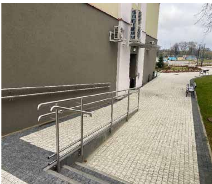
Fotografia 3. Urząd Miejski w Augustowie.

Poczta. Wejście do budynku całkowicie nieprzystosowane do potrzeb osób z niepełnosprawnością. Uderzające zestawienie z fotografią 1. – wejściem do Urzędu Miejskiego w Augustowie.