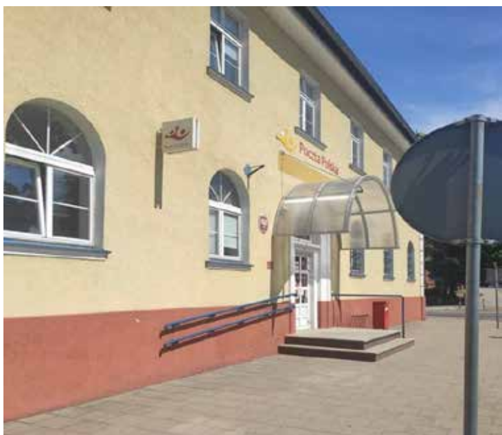
Fotografia 2. Augustów.

Poczta. Wejście do budynku całkowicie nieprzystosowane do potrzeb osób z niepełnosprawnością. Uderzające zestawienie z fotografią 1. – wejściem do Urzędu Miejskiego w Augustowie.